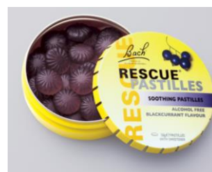
▲ ブラックカラント

販売名:レスキューパステル オレンジ / ブラックカラント<グミキャンディ> 価格:1,550円(税抜) 内容量:50g(標準36粒)